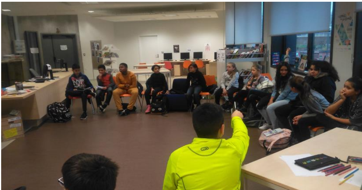
Un atelier philosophique avec l'association Philambule

Deux temps de rencontre sont organisés entre les élèves du 1er et du 2nd degré: l'un en janvier avec le journaliste et l'autre en fin de projet lors de la présentation aux parents.